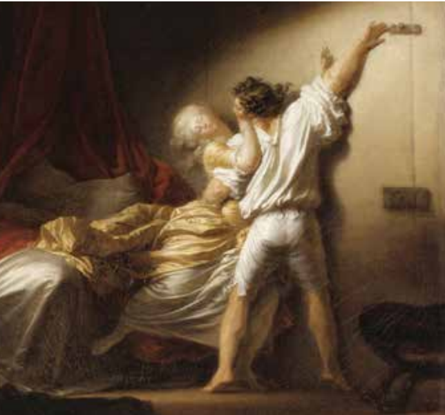
Le Verrou, Jean-Honoré Fragonard

jeudi 5 et vendredi 6 novembre à 19h30 ; samedi 7 à 18h ; mardi 10, mercredi 11 et jeudi 12 à 19h30 ; vendredi 13 à 19h30 ; samedi 14 à 18h ; mardi 17 à 19h30 ; mercredi 18, jeudi 19 et vendredi 20 à 19h30 ; samedi 21 à 18h. Hôtel à projets Pasteur, 2 Place Pasteur, Rennes.