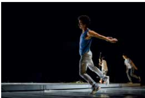
Concrète