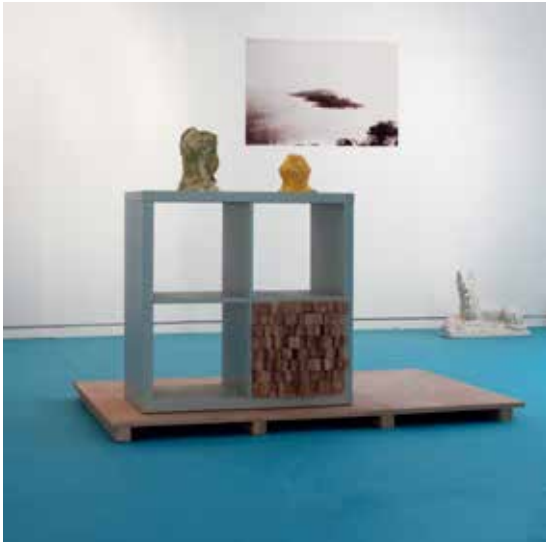
© David Droubaix / Vue de l'installation Les Heures, 2015