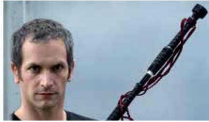
Erwan Keravec

Pour le deuxième des Premiers Dimanches de la saison, Les Champs Libres invitent Le Quartz qui propose un before de son festival NoBorder . Hasard du calendrier, ce sera aussi un after des Trans Musicales .