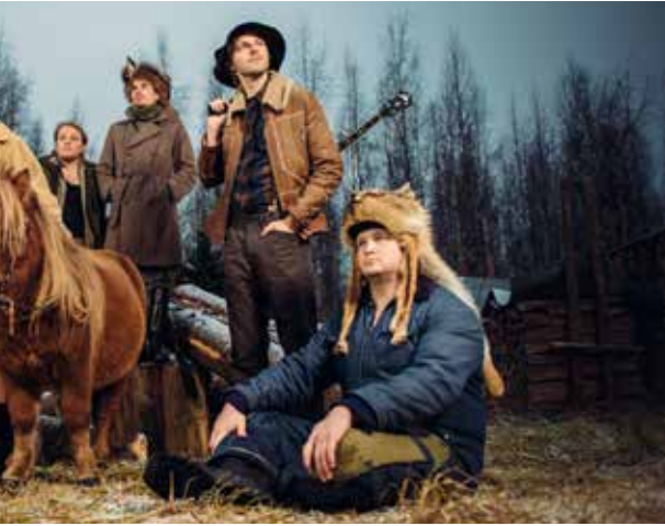
Steven Seagulls