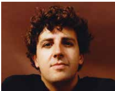
Jamie xx

Bernard Lenoir (la référence parlera aux nombreux festivaliers de plus de 40 ans) appelait ça des groupes tatapoum. Comprendre : l'éternel retour de la formule guitare-basse-batterie. Dans cette catégorie, La Route du Rock 2023 frappe fort (pensez d'ailleurs à vos bouchons d'oreilles) avec The Brian Jonestown Massacre, légendaire formation emmenée par Anton Newcombe, venue présenter un 19 e album de haute volée, voulu démodé donc indémodable. Dans la même catégorie rock psyché, impossible de louper The Black Angels ou même les petits frenchies de The Psychotic Monks qui n'ont pas à pâlir (ils le sont déjà assez, pâlots) de leurs aînés américains.