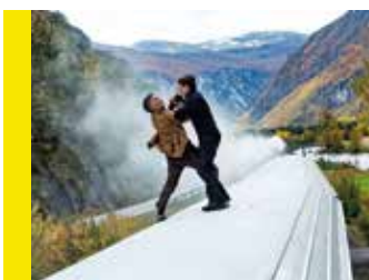
Mission Impossible - Dead Reckoning