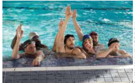
Tous dehors ! / Le grand bain