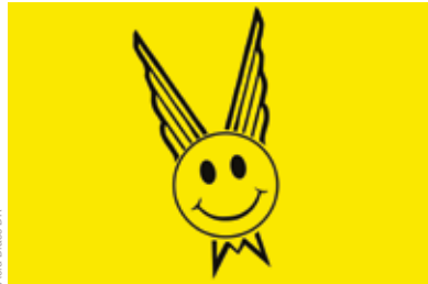
Acid Brass DR

Non, ce n'est pas parce que son titre est plus long que De et par la possibilité éventuelle des devenirs envisageables est un spectacle payant. Mais ce spectacle-performance en grande forme théâtrale devrait nous emmener loin et hors du temps pour envisager un autre futur ( Les Ateliers du Vent , les 5 et 6). Si vous aimez le théâtre, le Roméo et Juliette du Collectif Lyncéus va vous surprendre puisque le spectacle se joue sur le terrain de foot et chacun choisit son camp et ses couleurs en entrant (les 6 et 7, Complexe sportif Rapatel). Enfin, La Cie anversoise Marius est de retour avec Lorenzaccio , un événement dans l'événement (du 7 au 9, Parc du Thabor).