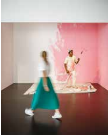
Duane Hanson - Housepainter I, 1984-1988