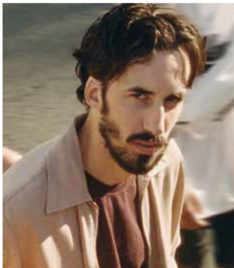
Lomepal