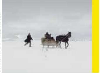
Les Herbes sèches

Le seul point commun avec le film précédent est sans doute sa durée (plus de 3 heures). Car un Nuri Bilge Ceylan, c'est évidemment un anti- Mission Impossible . Chez le Turc, tout est motif à contemplation. Et Les Herbes Sèches ne devrait pas faire exception à la règle, avec ses paysages enneigés qualifiés de sublimes par ceux qui ont découvert le film à Cannes (Prix d'interprétation féminine pour l'actrice Merve Dizdar).