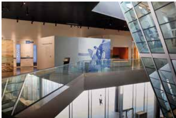
Les Champs Libres

Les Champs Libres, on entre pour rendre un livre à la bibliothèque et on ressort en ayant vu un concert, une conférence ou une exposition, il y a toujours un évènement.