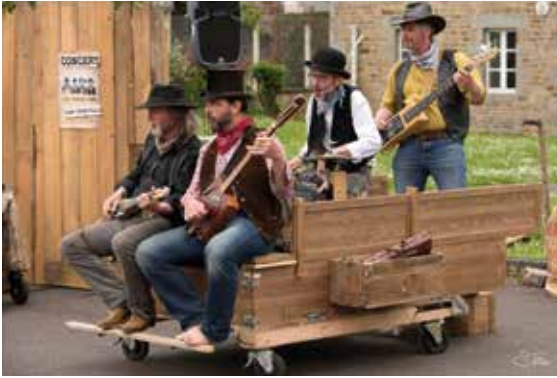
Olifan © Samuel Terni