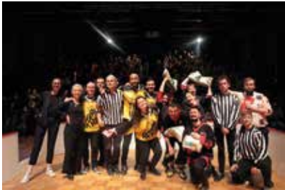
La Turi vs La Turi