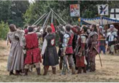
Les Médiévales de Brocéliande