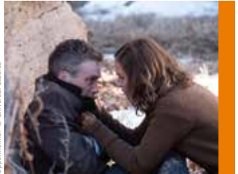
Oppenheimer

Vous n'avez toujours pas totalement compris Inception et Tenet ? Rassurez-vous, le nouveau Christopher Nolan devrait vous donner moins de fil à retordre. La complexité se trouve surtout dans le cerveau du héros de ce biopic interprété par Cillian Murphy, acteur nolanien par excellence : J. Robert Oppenheimer, qui n'est d'autre que le père de la bombe atomique.