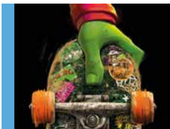
Ninja Turtles: Teenage Years