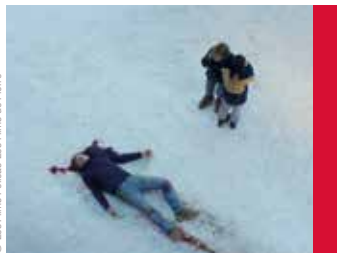
Anatomie d'une chute

Son discours de remise de prix a mis le feu aux poudres. « Enfant gâtée » entend-on à droite, « bien envoyé » rétorque-t-on à gauche. Justine Triet n'est pas qu'une observatrice du système (vertueux) de financement du cinéma français. C'est surtout une grande réalisatrice, liée à Cannes depuis son premier long ( La bataille de Solferino – la politique déjà !). Palme d'or 2023, Anatomie d'une chute porte mal son nom puisque ce film de procès existentiel risque de hisser Triet toujours plus haut dans le cinéma d'auteur français qu'elle défend ardemment.