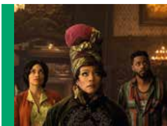
Le Manoir hanté