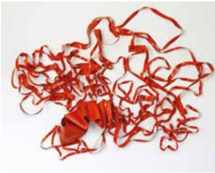
Bas relief, 2012 © Pierre-Alexandre Remy

Jusqu'au 3 décembre, Musée de Bretagne, Rennes.