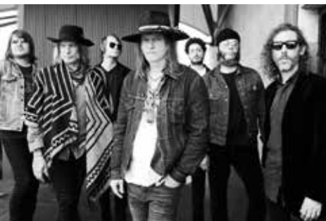
The Brian Jonestown Massacre