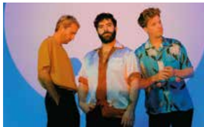
The Foals