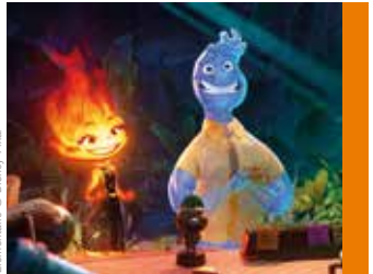
Élémentaire © Disney-Pixar

Depuis le premier Toy Story il y a bientôt 30 ans, il faut bien avouer que les films Pixar n'ont jamais déçu. Surtout, ils excellent dans leur capacité à proposer une infinité de niveaux de lecture. Élémentaire ne devrait pas déroger à la règle, à mi-chemin entre le premier cours de chimie (ne jamais mélanger les éléments !) et la réflexion sur le couple (les extrêmes s'attirent-ils ?).