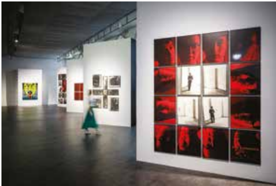
Gilbert & George De gauche à droite : Cry, 1984 Bummed, 1977 Cherry Blossom no. 9, 1974 A Drinking Sculpture, 1974 Bad Thoughts no. 7, 1975 © Gilbert & George Pinault Collection