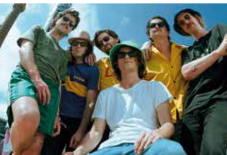
King Gizzard & The Lizard Wizard

Peu de guitares chez la tête d'affiche du festival mais une science des boîtes à rythmes (dubstep, garage, jungle...) couplée à des nappes synthétiques qui en font un créateur d'ambiance hors pair. En solo, Jamie xx n'a rien à envier au groupe qui l'a fait connaître, et il ne fait pas de doute que sa prestation devrait hypnotiser les foules en plus de les faire danser. Des sonorités electro-pop qui feront écho à un autre projet beaucoup plus discret, qui n'en reste pas moins l'un de nos coups de cœur : le duo touche-à-tout (de la drill aux envolées de violon) Jockstrap. Plus subtil que la pop en cinémascope de M83, autre tête d'affiche de cette 31 e édition ?