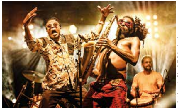
Les Fanfarfelses / Les Frères Smith