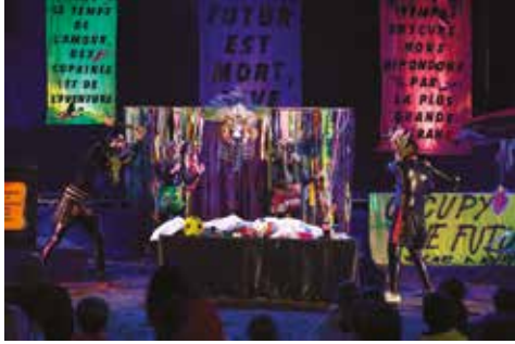
De et par la possibilité éventuelle des devenirs envisageables © Douglados Magal