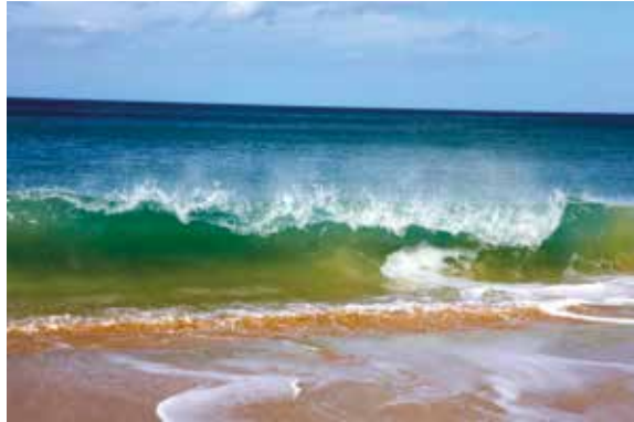
La couleur vert émeraude de la mer à Cancale