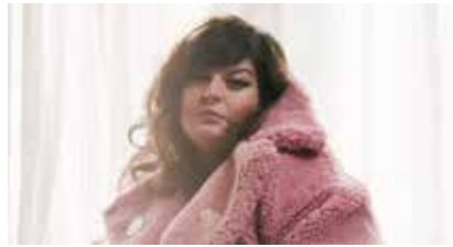
November Ultra

FESTIVAL INTERCELTIQUE Du 4 au 13 août, Lorient.