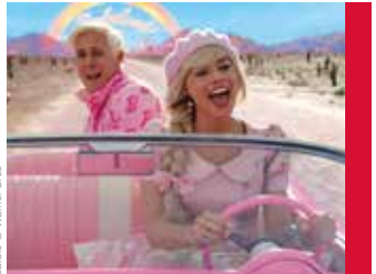
Barbie

Un film sur la poupée Barbie il l'heure de #meetoo et du complexe de l'homme blanc de plus de 50 ans, il faut oser ! Quand c'est la réalisatrice Greta Gerwig ( Les filles du Docteur March ) qui s'y colle avec comme scénariste Noah Baumbach ( Frances Ha ), on se dit que le projet ne manquera pas de piquant. Ajoutez un casting de premier choix (Margot Robbie en Barbie rebelle, Ryan Gosling en Ken bébé), et vous obtenez quelque chose comme le film le plus kitch et le plus branché de l'été.