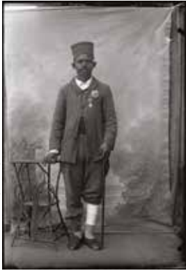
Portrait de soldat sénégalais, négatif sur verre - Henri Raullin