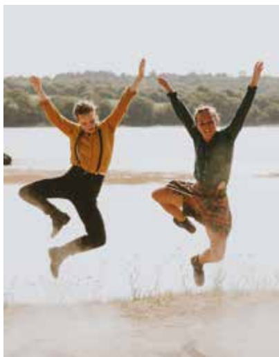
Tsef Zone © Mikhael Brun