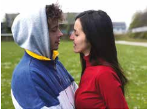
Roméo et Juliette

Le Grand Huit est donc ce nouveau lieu qui va célébrer les manèges anciens sur le site de l'ancien technicentre SNCF. Ouvert en avant-première tout juillet, Les Tombées y présentent I'm from la nuit (en collaboration avec I'm from Rennes ). Une chouette programmation qui devrait cartonner du 6 au 9 juillet. Un lieu pour la fête assurément.