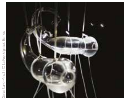
Clarisse Calvo-Pinault © La Pop & Immachinables