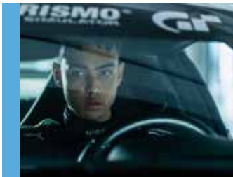
Gran Turismo