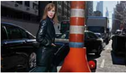
Suzanne Vega