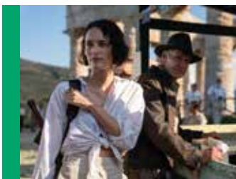
Indiana Jones et le Cadran de la Destinée