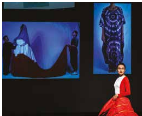
Portraits de famille