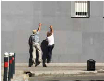
Les 7 Samourais

Parés pour la conquête de l'Ouest ? Les quatre cow-boys d'Olifan (30 juillet, 16h, Thabor) chevauchent les genres dans un rodéo musical jeune public « rockamburlesque ». Et si ce périple au soleil couchant ne suffit pas, The Jake Walkers (2 août, 20h, place de la Mairie) s'apprête à nous immerger en Louisiane dans une symbiose entre gospel, swing et blues à l'instinct primitif. En traversant l'Atlantique, de l'Acadie jusqu'à l'Espagne, Le Goût de l'étrange (12 juillet, 20h, place de la Mairie) nous propose de parcourir des collines aux vastes mers, à travers des histoires musicales tradi-baroques voguant entre rire et tristesse. Le voyage se poursuit de l'Europe de l'Est jusqu'à la Mongolie avec les compositions de Meïkhâneh (3 août, 20h, parc de Bréquigny), qui nous invitent à ressentir la nature et les grands espaces, sans frontières !