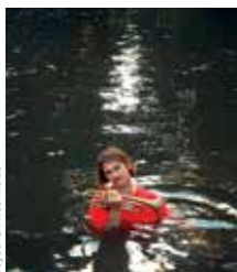
Yoann © Aïcha Menité