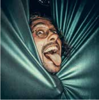
Festival Rock n'fées - | am Fez