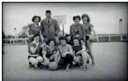
Vivre le sport - Équipe de basketballeuses

Vivre le sport À l'occasion des Jeux olympiques de Paris 2024 , le Musée de Bretagne a choisi de valoriser ses collections photographiques liées à la thématique du sport. Du jeudi 23 mai 2024 au dimanche 23 février 2025. Musée de Bretagne, Rennes.