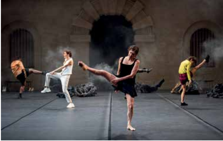
Black Lights © Marc Coudras