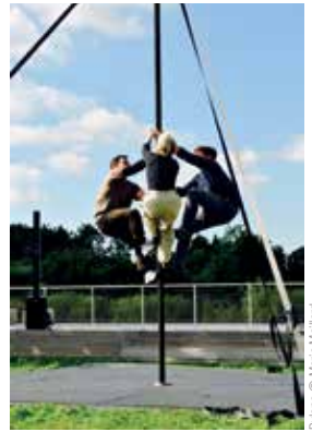
Pylônes © Marie Mallard