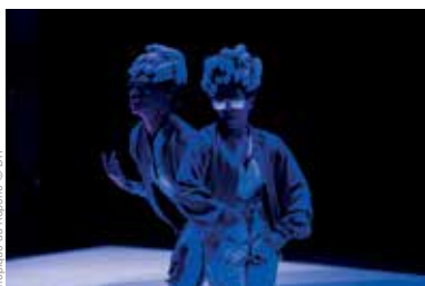
Tropique du Képone