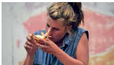
Ogiman - Cité Le Ventre