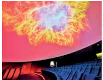
Le Planétarium