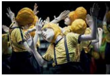
Pinocchio (live)