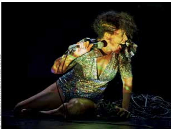
Mami Sargassa 3.0 et ses quests