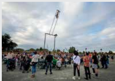
La Balançoire géante

Samedi 22 juin à partir de 14h. Ay-Roop [Le Milieu], Saint-Jacques-de-la-Lande.