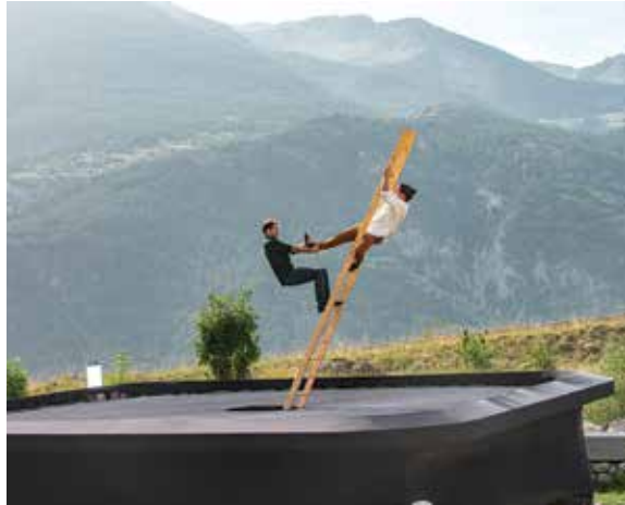
Le poids des nuages

Dans Le poids des nuages , les deux artistes de la compagnie Hors surface tentent l'impossible équilibre. Une grande échelle et un trampoline serviront d'ascenseur vers le ciel. Une entreprise folle mais sensationnelle. Entre envol, chute et suspension, cette seconde soirée défie les lois de la gravité, avant de convoquer la danse ancrée dans le bitume. Direction New Orleans et les rythmes afro-caribéens pour déambuler avec La fanfare Big Joanna qui aime, par-dessus tout, ensauvager les corps !