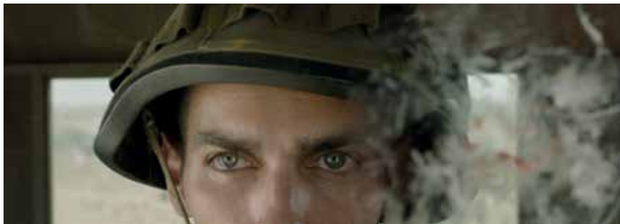
Le Songe d'une nuit sans rêve © Ali Cherrri

Parterre Eloïse Foulon regroupe des peintures de différentes dimensions. Installées par terre sur des supports en papier mâché, elles accompagnent un sol constitué de plusieurs plaques de cette même matière. Du lundi 13 au dimanche 19 mai. Orangerie du parc du Thabor, Rennes.