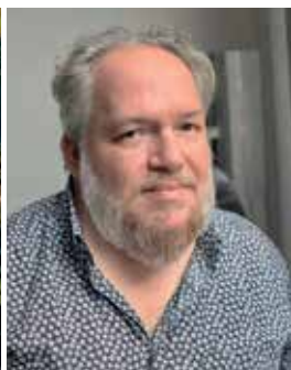
Mathias Énard