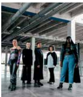
Stuck © Le Kabouki