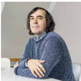
Mircea Cartarescu