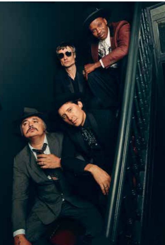
The Libertines