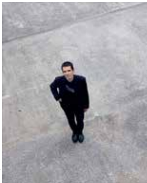
Lescop © Mathieu Tessier