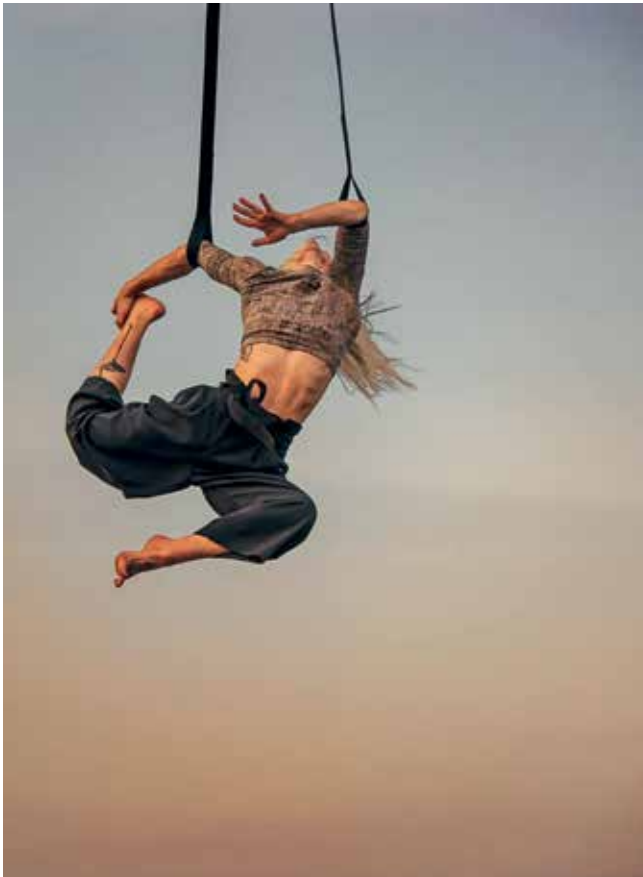
Peau d'âme © Roland Grifflon