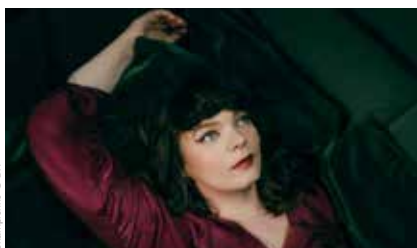
Championne