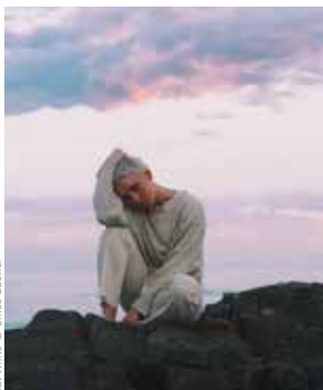
Kat White