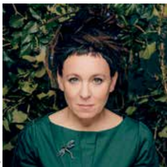
Olga Tokarczuk