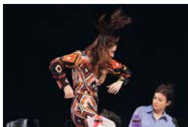
Limbo © Mélanie Luc