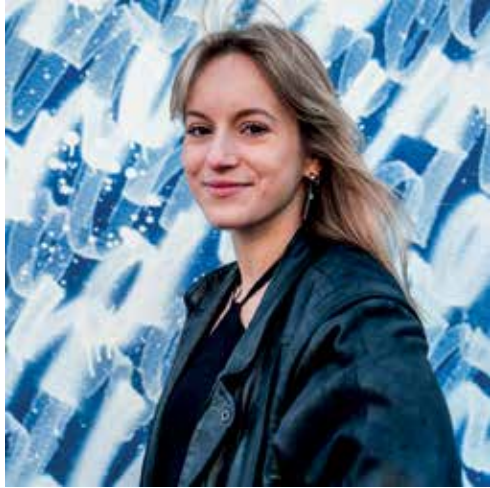
Made Festival - Galère sucrée